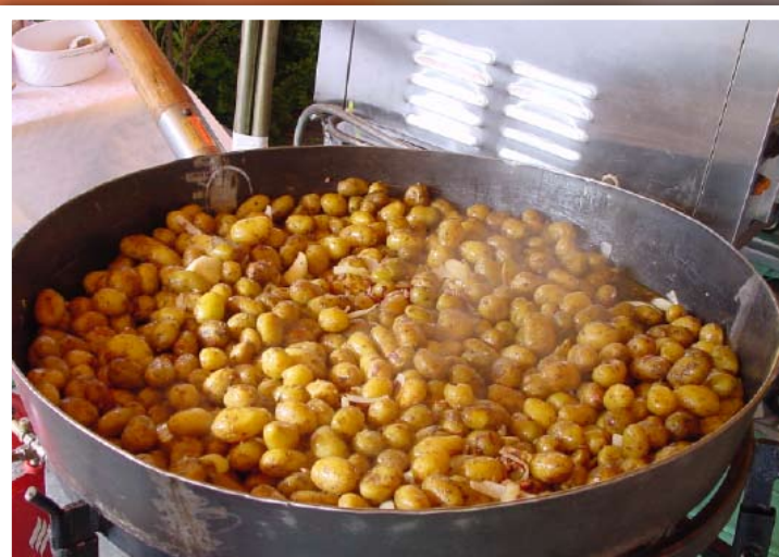
Rustikale Kartoffelpfanne „Bergische Art“