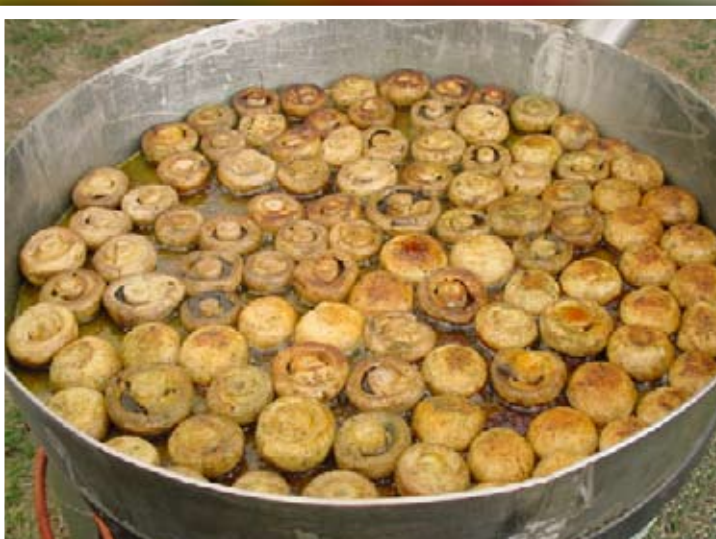
Riesenchampignons „Bergische Art“