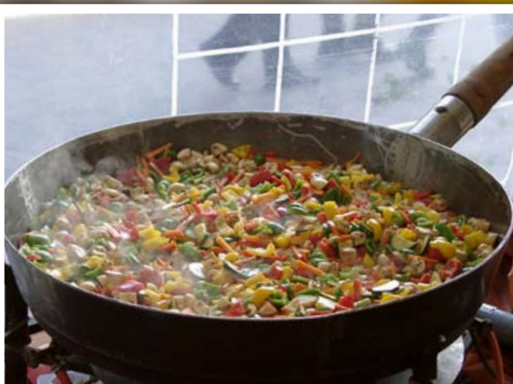
Riesenpfanne „Puszta Art“