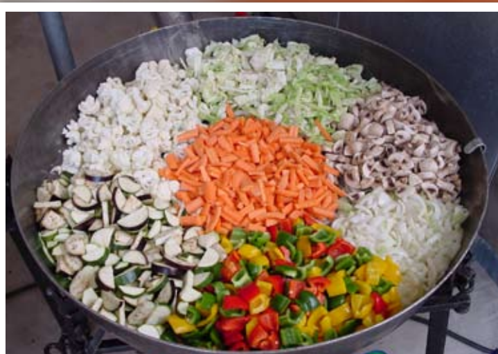
Riesengemüsepfanne „Bergische Art“