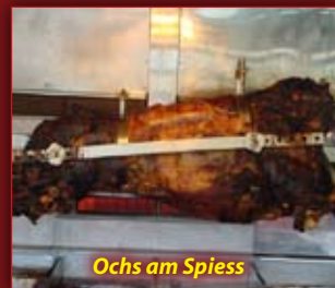
Ochs am Spiess